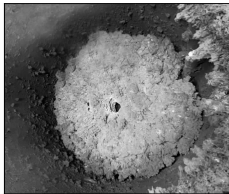
图 1 中心位置形成孔洞的海绵钛坨照片 Fig. 1 Photo of titanium sponge block with hole formed in the center

在 10 t 炉反应器中心位置插入一根直径 180 mm、长度 5500 mm 的钛棒,待镁还原-蒸馏结束后拔出钛棒,在制备的海绵钛坨中心位置形成直径约 180 mm 的孔洞,如图 1 所示。该孔洞在蒸馏时有利于中心部位氯化镁的蒸发,从而避免海绵钛底部形成夹心氯化镁。经计算,该孔洞可使海绵钛中部的蒸馏表面积由 0 \text{ m}^2 增加至 1.1 \text{ m}^2 。